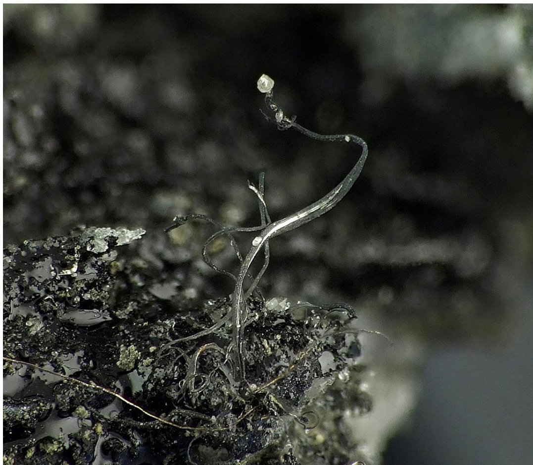
Trådsilver med en kristall av Cerrusit på toppen. Insamlad vid Lovisagruvan 2007.

Äntligen närmar sig utesäsongen igen efter en rekordkall och mörk vinter. Passa på att delta på föreningens exkursioner, det blir trevligare ju fler vi blir och kanske gör vi något extra bra fynd på någon av turerna.