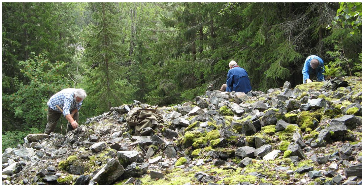
Vid Wolframgruvorna på Öraberg, Grängesberg, Augusti 2009

Årsmötet den 14/2 med sedvanliga årsmöteshandlingar, lättare förtäring och trevligt geologiprat besöktes av 7 medlemmar