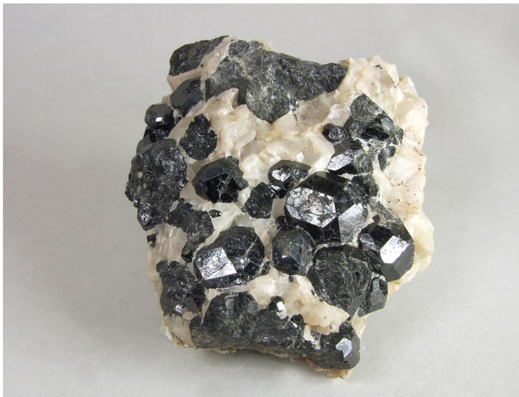
Granat från Körbergsklack, Hofors-Torsåker, samling och foto Per Wretling