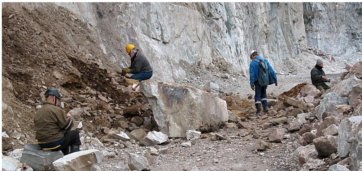
BGS vid Gåsgruvan i april 2010

22/8 besökte vi Hörken med Valdemarsgruvan och Vegagruvan. Prakstufferna uteblev men vi hittade scheelit, molybdenglans, granat m.m. Vi var 6 medlemmar i fint sensommarväder.