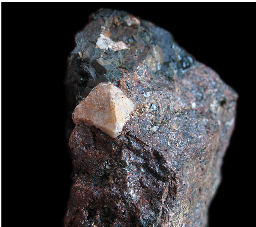
Scheelitkristall från Valdemarsgruvan i Hörken. Insamlad augusti 2010. Kristallen ca 1.5cm stor.

Välkommen till höstnumret av vår medlemstidning. Vi hoppas sommaren inneburit inte bara sol, värme och avkoppling utan även bra mineralfynd eller geologiska upplevelser.